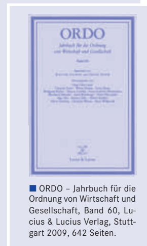
■ ORDO – Jahrbuch für die Ordnung von Wirtschaft und Gesellschaft, Band 60, Lucius & Lucius Verlag, Stuttgart 2009, 642 Seiten.

Gerade angesichts der großen Finanz- und Wirtschaftskrise hält es Willgerodt nicht für den passenden Zeitpunkt, an den deutschen Hochschulen die wissenschaftliche Wirtschaftspolitik zurückzudrängen und die Lehre von der Ordnungspolitik in die Dogmengeschichte zu verbannen, die selbst schon Opfer eines falschen Modernismus geworden sei. Bezogen auf die Krise wendet er sich gegen „ziemlich unbescheidene Belehrungen“ ausgerechnet „von denen, deren Konzepte praktisch gescheitert sind“, insbesondere denen aus den Vereinigten Staaten. So hält es Willgerodt für geboten, „dass man gerade jetzt über neue Ordnungsregeln nachdenken